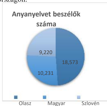
3. grafikon: Az anyanyelvet beszélők száma Horvátországban a 2011-es népszámlálás adatai szerint

Ugyanezen népszámlálások szerint az alábbi grafikonok a szlovén, az olasz és a magyar anyanyelvet beszélők számát mutatják Horvátországban, valamint a román, a német és a horvát anyanyelvűek számát Magyarországon.