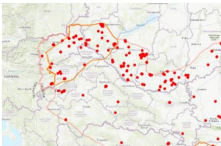
1.kép: Geotermikus létesítmények Magyarország és Horvátország határ menti területein 27

A határokon átnyúló együttműködés lehetőségei az állami szektor épületeinek, a vállalkozásoknak és a háztartásoknak az energiahatékonyságával kapcsolatos ismeretek és tapasztalatok cseréjében, valamint a megújuló energiaforrások, például a napenergia, a geotermikus energia és a biomassza energia előmozdításában merülnek fel.