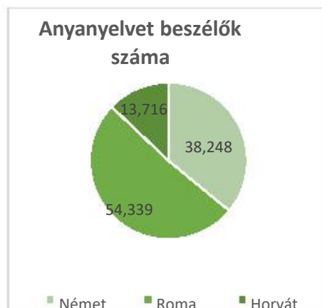
4. grafikon: Az anyanyelvet beszélők száma Magyarországon a 2011-es népszámlálás adatai szerint

A nemzeti kisebbségek tagjaival való együttélés lehetővé teszi a kölcsönös szokások és kultúra megismerését és jobb megértését, és megalapozza a határokon átnyúló együttműködést. A tanulmány előző része röviden ismerteti az előző programozási időszakban megvalósult projekteket, amelyek eredményei közvetlen hatással bírnak a határ menti lakosok életminőségére. A projektek növelik a térség természeti és kulturális örökségének vonzerejét, olyan határokon átnyúló turisztikai termékek kerülnek fejlesztésre amelyek egyedülálló élményt és turisztikai élményt tesznek lehetővé, valamint találkoznak és kapcsolatba lépnek a helyi termelőkkel és a lakossággal. A történelmi tények, a kulturális és természeti örökség, valamint a határon átnyúló területek folklór-történeteinek összekapcsolásával fejlesztésre kerül a helyi lakosság együttműködése a határ mindkét oldalán. Az új turisztikai termékek fejlesztése, a természeti és kulturális örökség megőrzése, valamint a határ menti érdekelt felek üzleti együttműködése hozzájárul az új munkahelyek létrehozásához, az életminőség javításához, az életszínvonal emeléséhez és az elnéptelenedési folyamat megakadályozásához.