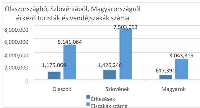
5. grafikon: A Horvátországba érkező turisták és vendégéjszakák száma 2019. évben