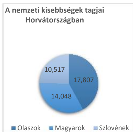
1. grafikon: A nemzeti kisebbségek tagjainak száma Horvátországban 2011-ben

Az INTERREG programban való részvétel a szomszédos országokkal, elsősorban az előző részekben felsorolt országokkal és a közös projektek megvalósításában lehetőséget nyújt új ismeretek, készségek és tapasztalatok megszerzésére, de mindenekelőtt új kapcsolat létrehozására és a meglévő jószomszédi kapcsolatok fenntartására. Tekintettel arra, hogy a határ menti területek közelségük miatt sok közös életkörülményekkel rendelkeznek, arra a következtetésre jutunk, hogy a kulturális és társadalmi jellemzők nem sokban különböznek egymástól. A Horvát Köztársaság 2011. évi népszámlálási adatai szerint a horvátországi szlovén, olasz és magyar nemzeti kisebbségek tagjainak száma több ezer főre tehető. 16 Magyarország 2011-es népszámlálása szerint a lakosság többsége a roma és a német nemzetiséghez tartozik, míg a horvát nemzetiséghez 26 774 fő, ami 2001. évi népszámláláshoz képest 4,1% -os növekedést jelent. 17