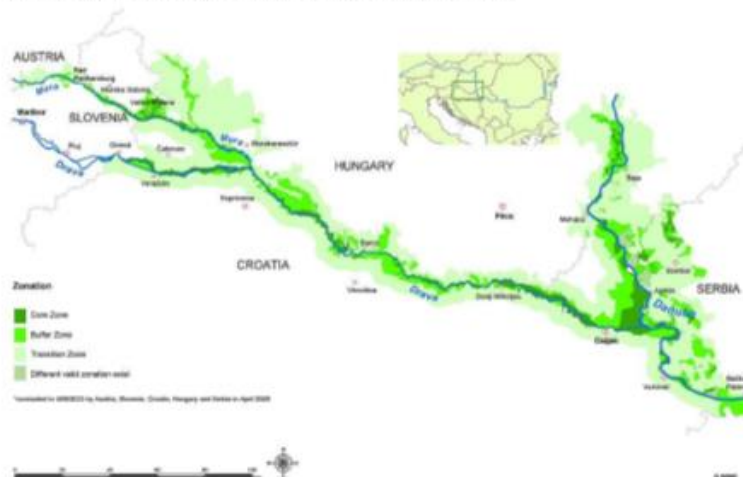
2. kép: Mura Dráva Duna Bioszféra Rezervátum 29

A határ menti területek és azok biológiai sokfélesége megőrzésével kapcsolatos együttműködés magában foglalhatja a városi területek nyilvános területeinek intelligens használatát, a környezet és a természet védelmét, valamint a növény- és állatfajok, például a vizes élőhelyek természetes élőhelyeinek helyreállítási folyamataihoz igazított tevékenységeket, mocsarakat vagy sivatagokat. Annak érdekében, hogy ezek a tevékenységek a lehető leghatékonyabban végrehajthatók legyenek a helyi önkormányzatokat ösztönözni kell, valamint a kezdeményezéseket és a civil társadalmi szervezetek a határokon átnyúló partnerekkel való együttműködés támogatása szükséges illetve szükségesek a tapasztalatok és ismeretek cseréjére.